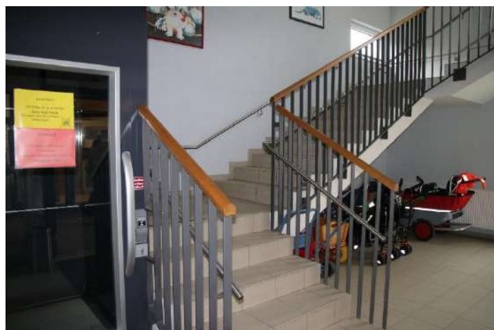
Treppenhaus mit Aufzug und Kinderwagenparkplatz / Nebengebäude

Über einen Schließzeitenplan und über die Kita-Info-App werden die Eltern rechtzeitig darüber informiert.