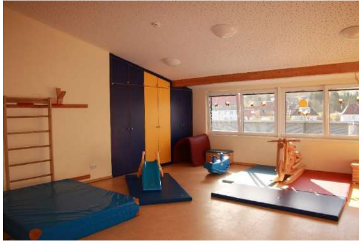
Bewegungsraum / Nebengebäude