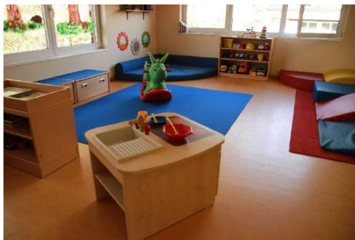
Gruppenraum Zwerge / Nebengebäude