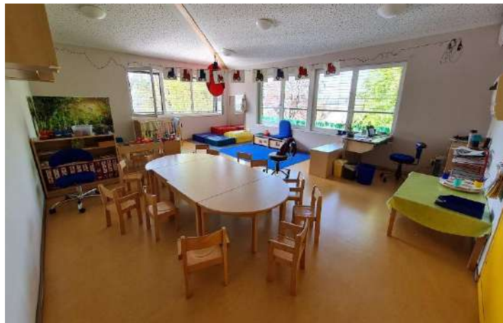
Gruppenraum Wichtel / Nebengebäude

Lernen im Spiel bedeutet Lernen durch praktische Erfahrungen. Im nicht angeleiteten Spiel entwickeln die Kinder Fantasie und Kreativität. Sie werden zum eigenen Handeln angeregt und ermutigt.