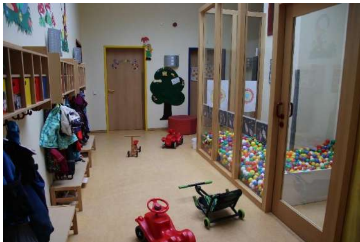
Flur im Krippenbereich / Nebengebäude

Unsere Krippengruppen nehmen maximal 12 Kinder im Alter von 1 bis 2 Jahren auf. Mit Vollendung des 3. Lebensjahres, spätestens jedoch zum Anfang des neuen Kindergartenjahres wechseln unsere Krippenkinder in eine altersgemischte Gruppe des Kindergartenbereiches (3 bis 6 Jahre/bzw. 2-6 Jahre). Der Wechsel des Zeitpunktes kann unterschiedlich sein und ist von den jeweiligen Belegungszahlen abhängig. Individuellen Vereinbarungen mit den Eltern der Krippenkinder stehen wir hier offen gegenüber, sofern die Belegungssituation in Krippe und Kindergartenbereich dies zulässt.