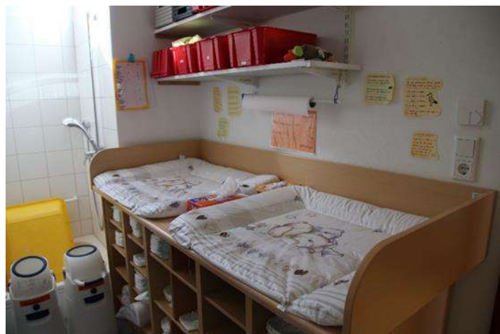
Wickelplatz / Nebengebäude

Außerdem sollte für jedes Kind ein kompletter Satz Wechselkleidung bei uns deponiert werden.