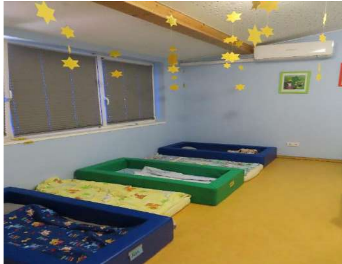
Schlafräum / Nebengebäude