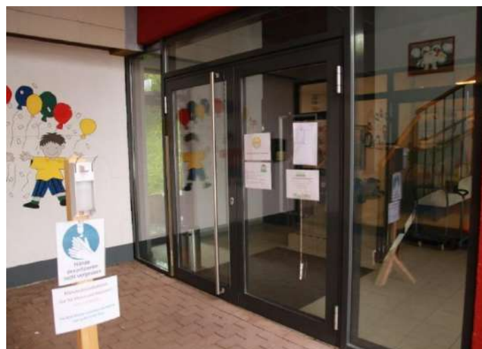
Eingangsbereich / Nebengebäude

Ganztagsplätze mit Mittagessen können spontan auch bis zum Mittwoch der Vorwoche gebucht werden , solange freie Plätze zur Verfügung stehen. Die Buchungsliste hängt im Eingangsbereich aus.