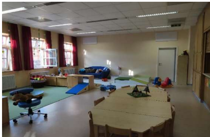
Gruppenraum Eulennest / Festhalle